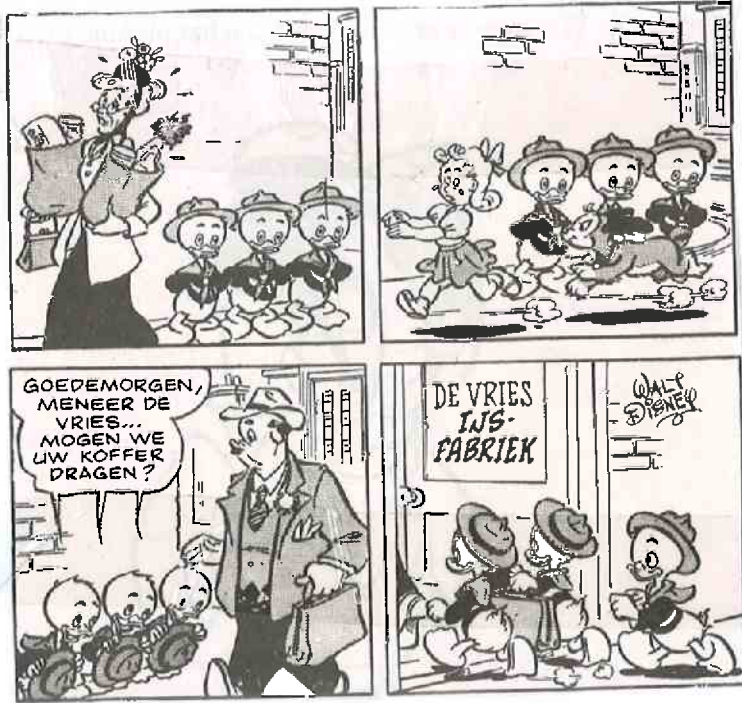
Donald Duck scheur - kalender